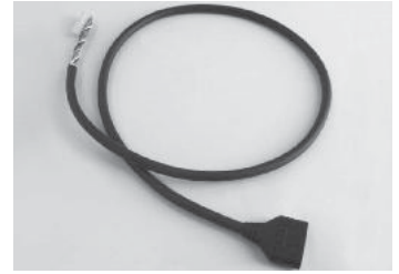
延長ケーブル・全体