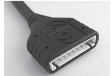
コネクタ部(9Pタイプ)